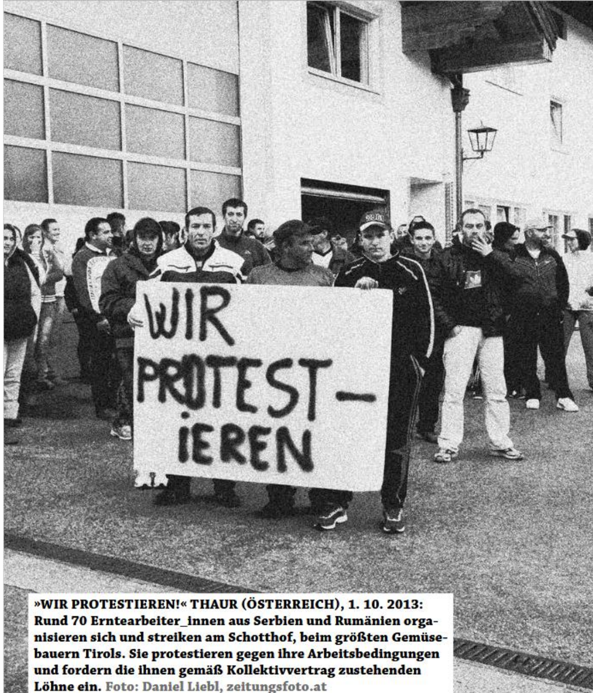
»WIR PROTESTIEREN!« THAUR (ÖSTERREICH), 1. 10. 2013: Rund 70 Erntearbeiter_innen aus Serbien und Rumänien organisieren sich und streiken am Schotthof, beim größten Gemüsebauern Tirols. Sie protestieren gegen ihre Arbeitsbedingungen und fordern die ihnen gemäß Kollektivvertrag zustehenden Löhne ein.